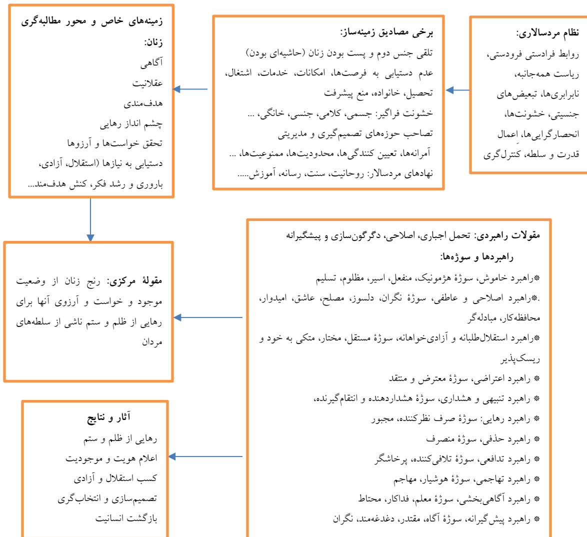
نمودار شماره دو - مدل راهبرد

است. آنها با اعلام صریح نارضایتی از خشونت‌ها، تبعیض‌ها و نابرابری‌ها، با کنش‌های متعدّد و پیوسته، درصدد تغییر وضع موجود به نفع خود و تغییر ساختارها هستند.