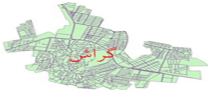
نقشه شماره یک- منطقه مورد مطالعه