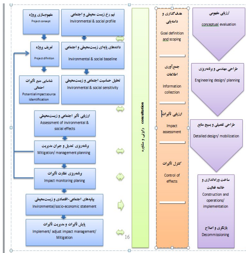
شکل شماره‌ی دو: نمودار مراحل متوالی انجام ارزیابی تأثیر اجتماعی

اتحادیه‌ی تولیدکنندگان نفت و گاز نیز مدلی از مراحل متوالی انجام مطالعات ارزیابی تأثیر زیست‌محیطی و اجتماعی ارائه کرده است که اگرچه پیچیدگی‌های بیش‌تری دارد، لیکن جوهره‌ی آن از آنچه مدل‌های پیشین ارائه می‌کنند متفاوت نیست (۹، ۱۹۹۷، OGP). این مدل بر مبنای «ارزیابی زیست‌محیطی راهبردی» طراحی شده است. در این نوع ارزیابی، بخش زیست‌محیطی و اجتماعی در کنار یکدیگر قرار داده می‌شوند و ارزیابی به‌طور هم‌زمان صورت می‌گیرد. مدل مذکور از پنج ستون تشکیل شده و اهم نکات درباره‌ی آن به شرح شکل زیر است: