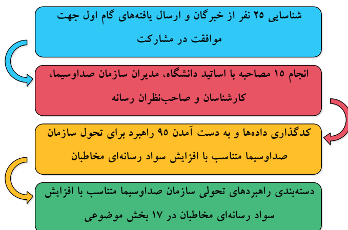
شکل ۲: فرآیند پژوهش در یک نگاه

در مرحله بعد، یافته‌های هر مصاحبه به صورت مجزا کدگذاری شد و پس از چندین مرحله دسته‌بندی، بازنویسی، جمع‌بندی و همچنین حذف متشابهات، ۹۵ راهبرد برای تحول سازمان صداوسیما، متناسب با افزایش سواد رسانه‌ای مخاطبان در ۱۷ بخش با عناوین؛ اعتماد مخاطب و بی‌طرفی رسانه، مخاطب پژوهی، تکثیر و تنوع و چندصدایی در رسانه ملی، اقناع مخاطبان، درآمدزایی و کاهش هزینه‌ها، تولیدات، نیروی انسانی، فضای مجازی و رسانه‌های اجتماعی، سیاست‌گذاری، رقبا، آینده‌پژوهی، محتوای تولیدشده توسط کاربر، آسیب‌شناسی و اثرسنجی، مزیت رقابتی، نخبگان، برنامه‌ریزی پخش (کنداکتور) و سرعت طبقه‌بندی شدند.