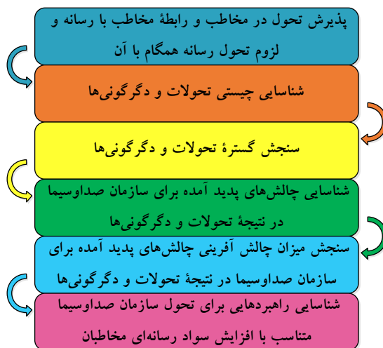
شکل ۳: مسیر سازمان صداوسیما در راه تحول متناسب با افزایش سواد رسانه‌ای مخاطبان

الزام کلیدی و اساسی برای تحول در این سازمان نیز همچون سایر سازمان‌ها در مرحله‌ی اول، پذیرش تحول در مخاطب و رابطه مخاطب با رسانه، توسط مدیران و سیاست‌گذاران رسانه‌ای این سازمان است. این تغییر ذهنیت در مدیران که می‌تواند یکی از سخت‌ترین الزامات این امر باشد، بستر لازم برای مرحله اول تحول از دیدگاه کرت لوین ۱ یعنی مرحله‌ی خروج از انجماد را مهیا سازد.