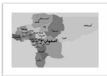
شکل شماره‌ی سه- موقعیت شهرستان آران و بیدگل در استان اصفهان

شهرستان آران و بیدگل از توابع استان اصفهان با وسعت ۶۰۵۱ کیلومتر مربع در پنج کیلومتری شمال کاشان واقع شده است. این شهرستان که در حاشیه‌ی جنوب غربی کویر مرکزی ایران قرار دارد، از شمال به دریاچه‌ی نمک و استان سمنان و قم، از مشرق به شهرستان‌های نطنز و اردستان و از جنوب و غرب به شهرستان کاشان و رشته جبال مرکزی ایران محدود است (سلمانی آرانی، ۱۳۷۷: ۹).