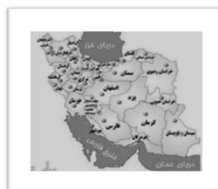
شکل شماره‌ی دو- موقعیت استان اصفهان در ایران