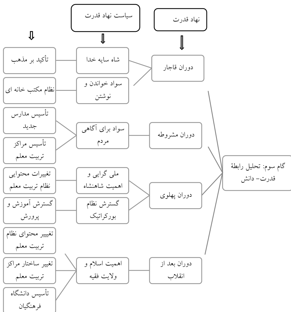
نمودار شماره سه - تحلیل رابطه قدرت دانش