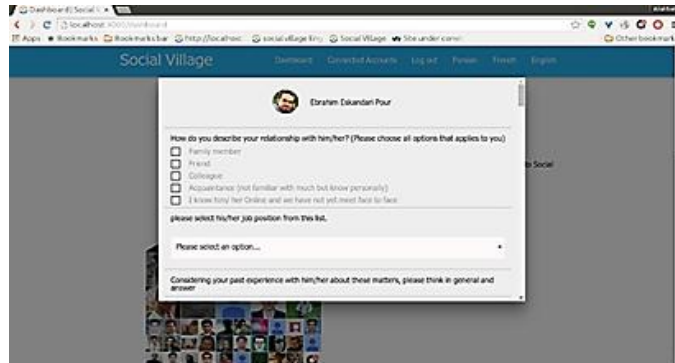
شکل شماره‌ی سه- سؤالات سرمایه‌ی اجتماعی مجازی درباره‌ی دوستان پاسخ‌گو

پروفایل دوستان پاسخ‌گو در شبکه‌ی اجتماعی مجازی، با نمایش نام و تصویر پروفایل دوستان از پاسخ‌گو درخواست شده است به سؤالات پاسخ دهد. این نحوه‌ی پرسش در شکل شماره‌ی سه نشان داده شده است.