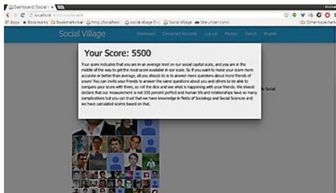
شکل شماره‌ی چهار- امتیاز سرمایه‌ی اجتماعی مجازی پاسخ‌گو به همراه تفسیر آن

پس از پاسخ‌گویی به سؤالات سرمایه‌ی اجتماعی مجازی (که به‌طور جداگانه درباره‌ی شبکه‌ی اجتماعی فیس‌بوک و گوگل پلاس طرح می‌شوند)، بر اساس میزان حمایت و منابع دریافتی پاسخ‌گو از دوستانش، امتیاز سرمایه‌ی اجتماعی مجازی در لحظه محاسبه می‌گردد و به همراه تفسیر مختصری از معنای این امتیاز (جایگاه پاسخ‌گو در طیف حداقل و حداکثر سرمایه‌ی اجتماعی مجازی) به او ارائه می‌شود. این فرایند در شکل شماره‌ی چهار نشان داده شده است.