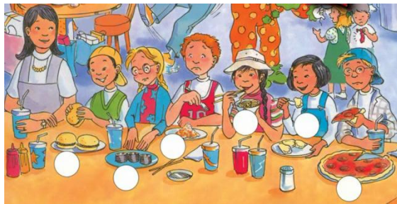
شکل شماره‌ی هفت- نمونه مصرف انواع غذاهای غربی

تنوع‌گرایی در مصرف مواد غذایی، به ویژه غذاهای غربی در این منابع زیاد به چشم می‌خورد؛ همانند همبرگر، پیتزا، اسپاگتی و غیره. به نظر بوردیو سلیقه یکی از آشکارترین نشانه‌های عادت‌واره است که رابطه‌ی مستقیم با موقعیت طبقاتی دارد و می‌تواند از راه آموزش منتقل شود؛ بنابراین آموزش این تنوع غذایی غربی در قالب آموزش زبان، می‌تواند سلیقه و تمایلات نوجوانان را شکل دهد. مه‌ری بهار در کتاب مصرف و فرهنگ نیز به بحث ترجیحات غذایی افراد در گروه‌های مختلف اجتماعی اشاره کرده است (بهار، ۱۳۹۰).