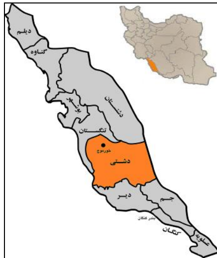
شکل شماره‌ی دو- موقعیت مکانی شهر خورموج و محلات ۱۰ گانه‌ی آن بر روی نقشه