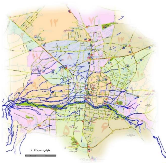
نقشه شماره‌ی یک - پراکنش شبکه‌ی مادی‌ها در اصفهان معاصر، بر اساس برداشت‌های سازمان فاوا (نگارندگان، ۱۳۹۷).

جلب کرده و آنها را از اهمیت چرخه‌ی طبیعی آب آگاه می‌کند (هویر و دیگران ۵ ، ۲۰۱۱: ۳۰).