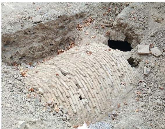
شکل شماره‌ی یک- کانال آب مکشوفه در نزدیکی بازار هنر (نگارندگان، ۱۳۹۶).

وجود آب جاری در مادی‌ها به عنوان یک محور طبیعی خطی باعث گردیده که از آن‌ها به‌عنوان رگ‌های حیاتی شهر اصفهان یاد شود. اگرچه مادی‌ها پیش از صفویه نیز در منطقه‌ی اصفهان وجود داشته‌اند (ناصرخسرو، ۱۳۸۴: ۱۶۶؛ حمداله مستوفی، ۱۳۶۴: ۲۴۸)، اما تنها برای آبیاری مزارع و باغ‌ها مورد استفاده قرار می‌گرفتند و شبکه‌ی گسترده‌ی مادی‌های بافت شهری در دوره‌ی شاه عباس اول احداث گردیده است. جدا از فلسفه‌ی کاربردی وجود مادی‌ها برای آب‌رسانی به محلات، اهمیت آن‌ها از جنبه‌های دیگر نیز مورد توجه است؛ حضور زنده‌ی رودخانه در ترکیب اصفهان صفوی پیونددهنده‌ی عناصر طبیعی با تمامیت شهر بوده است. کارکرد دیگر این سازه‌های شهری جمع‌آوری آب‌های سطحی حاصل از بارندگی است که مانع از آب‌گرفتگی معابر شهری می‌شده. با وجود قطع بسیاری از شاخه‌های مادی‌ها پس از صفویان، این عملکرد امروزه نیز همچنان کاربردی است و اصفهان را در برابر سیل محافظت می‌کند (نقشه‌ی ۱).