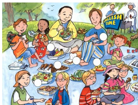
شکل شماره‌ی سه- شرکت دانش‌آموزان غیر هم جنس در پیک‌نیک