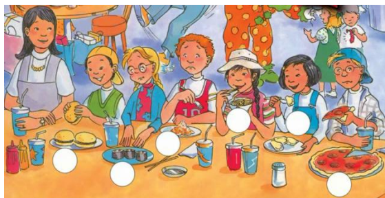
شکل شماره‌ی هفت- نمونه مصرف انواع غذاهای غربی

تنوع‌گرایی در مصرف مواد غذایی، به ویژه غذاهای غربی در این منابع زیاد به چشم می‌خورد؛ همانند همبرگر، پیتزا، اسپاگتی و غیره. به نظر بوردیو سلیقه یکی از آشکارترین نشانه‌های عادت‌واره است که رابطه‌ی مستقیم با موقعیت طبقاتی دارد و می‌تواند از راه آموزش منتقل شود؛ بنابراین آموزش این تنوع غذایی غربی در قالب آموزش زبان، می‌تواند سلیقه و تمایلات نوجوانان را شکل دهد. مه‌ری بهار در کتاب مصرف و فرهنگ نیز به بحث ترجیحات غذایی افراد در گروه‌های مختلف اجتماعی اشاره کرده است (بهار، ۱۳۹۰).