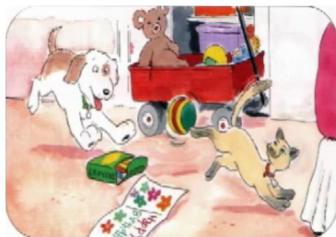
شکل شماره‌ی پنج- نمونه بازی حیوانات خانگی در اتاق نوجوانان

۲- ارتباطات حیوان با حیوان: این منابع نشان می‌دهند که حیوانات همانند انسان‌ها دارای عواطف و احساسات و دارای ساختارهای روابط اجتماعی هستند. در بعضی بخش‌های کتاب و داستان، ارتباطات حیوان با حیوان هستیم؛ به طوری که حیوانات با هم‌دیگر صحبت می‌کنند؛ به ورزش می‌روند، بازی می‌کنند و ماجراهای مخصوص به خود را دارند. اگرچه چنین روایتی جنبه‌ی سرگرم‌کننده‌ی بالایی دارند باید توجه داشت از آن‌جا که این حیوانات غالباً خانگی و دست‌آموز هستند مجدداً فرهنگ نگهداری از حیوانات در منزل را رواج می‌دهند.