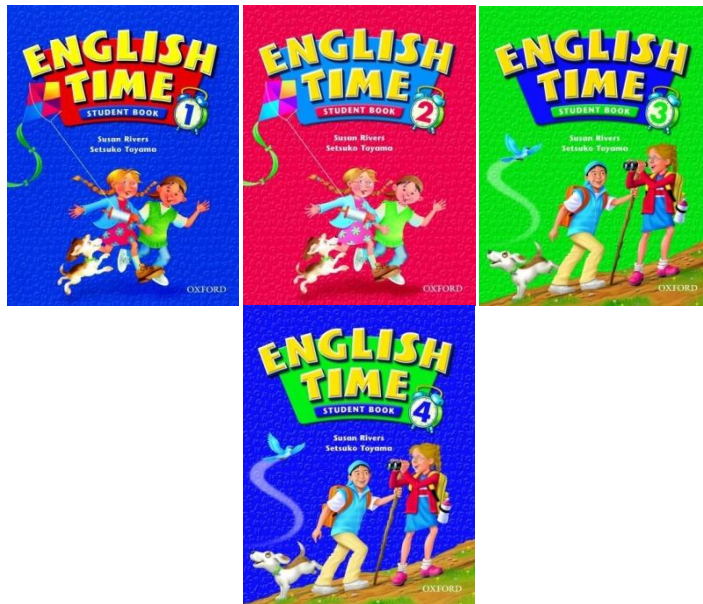
شکل شماره‌ی یک- طرح جلد کتاب‌های ۱ تا ۴ انگلیش تایم

واقع عادت‌واره‌های غربی از طریق زبان به نوجوانان منتقل و آن‌ها نیز با حفظ، تکرار و تمرین، این عادت‌واره‌ها را یاد می‌گیرند و به‌طور ناخودآگاه آن‌ها را محور رفتارهای خود قرار می‌دهند.