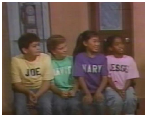
شکل شماره‌ی شش - نمونه پوشش شلوار جین

در این منابع پوشش شخصیت‌ها مطابق با موازین جمهوری اسلامی نیست؛ اما سعی شده است تا بامهارت‌های گرافیکی، بسیاری از این عدم مطابقت‌ها را اصلاح کنند. جدای از این مسأله، تعدادی از لغاتی که در باره‌ی نحوه‌ی پوشش به دانش‌آموزان آموزش داده می‌شود مربوط به نحوه‌ی پوشش غربی است به‌عنوان مثال شلوار جین. طبق نظر بورديو یکی از مؤلفه‌های سازنده‌ی عادت‌واره نوع پوشش است که ارتباط مستقیمی با طبقه‌ی اجتماعی افراد نیز دارد (گرنفل، ۲۰۰۸). لذا بر اساس نظریه‌ی بورديو نمایش نحوه‌ی پوشش غربی در کتاب‌های زبان می‌تواند به‌طور غیرمستقیم این ذهنیت را در زبان‌آموز ایجاد کند که پوشش شلوار نوعی نزدیک شدن به فرهنگ بالاتر است.